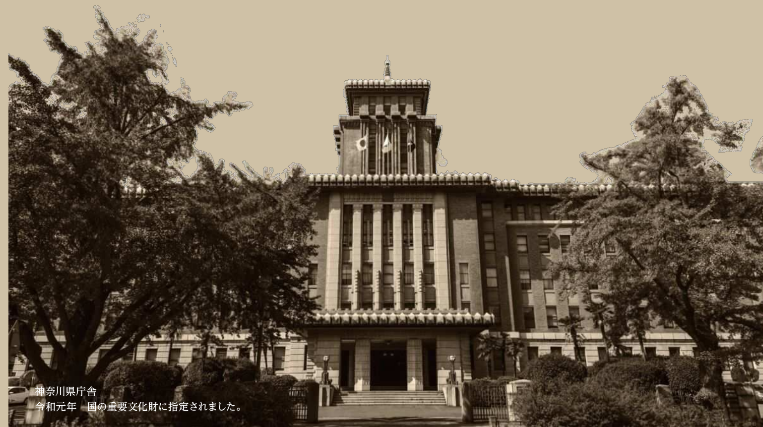
神奈川県庁舎 令和元年 国の重要文化財に指定されました。

【お問合せ】神奈川県教育委員会教育局生涯学習部文化遺産課 横浜市中区日本大通 33 TEL 045-210-8359（直通） FAX 045-210-8939