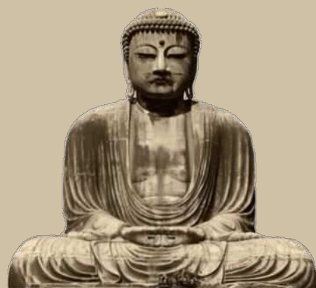
銅造 阿弥陀如来坐像（鎌倉大仏）鎌倉市：国宝