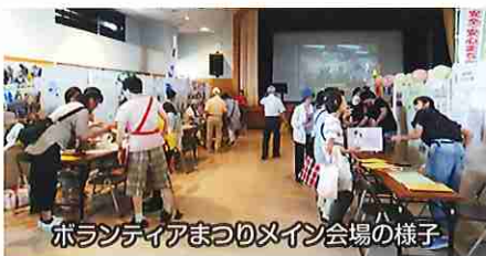
ボランティアまつりのメイン会場の様子