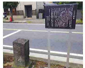
県道22号沿い「二十三夜塔」