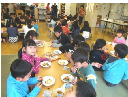
おいしいな！手作りおやつ

放課後、保護者が就労等で留守となる家庭の児童を預かる「児童クラブ」、長後地区には3ヵ所ある。