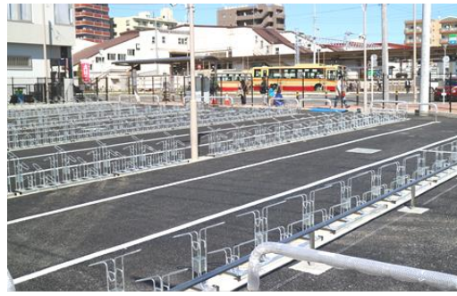
オープンを待つ自転車等駐車場

放置自転車対策の一環として、西口駅前広場改修に伴い昨年の9月から整備工事が行われていた。名称は「長後駅西口自転車等駐車場」。収容台数4