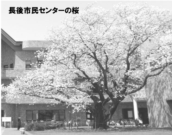
長後市民センターの桜