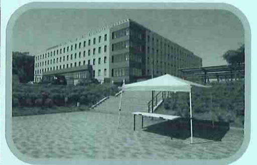
初回は雨で使わず、二回目開催が待ち遠しいテント