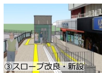
③スロープ改良・新設