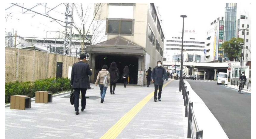
整備後 (ベンチ・植栽・照明灯の設置)