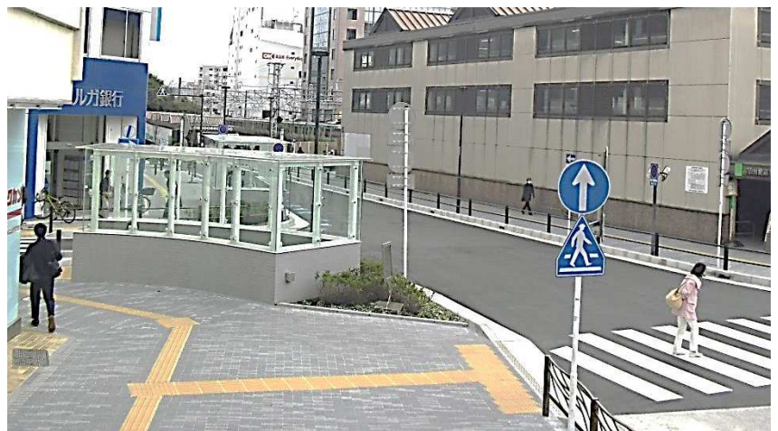
整備後 (階段上屋の更新)