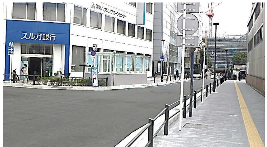
整備後 (歩道の拡幅・舗装の更新)