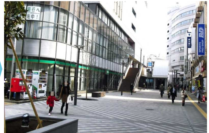
整備後 H29年3月 (歩道改良工事完了)