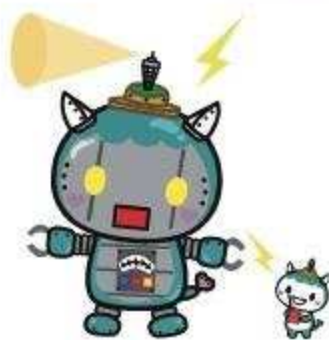
「キェンとするまち藤沢」 公式マスコットキャラクター ふじキェンQ(ロボット Ver.)

藤沢市は今も人口増加を続ける「成長する都市」で、湘南の元気都市にふさわしい魅力と活力に満ちた「まち」づくりを進めています。江の島、湘南海岸を有する観光都市であり、市内に4大学を有する学園都市であり、工場や商業施設が集積する産業都市である、6路線21駅を有する住みやすく、働きやすい都市です。