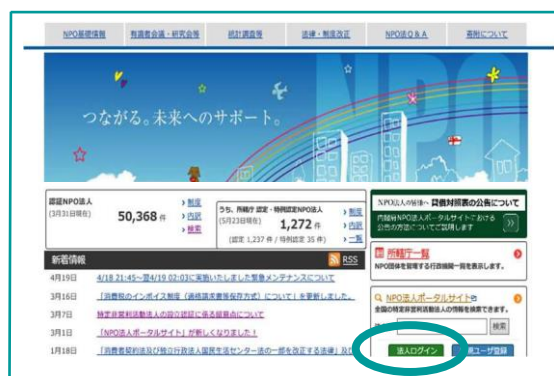
内閣府 NPO ホームページ

※登録方法の詳細については、表面の内閣府ポータルサイトの URL より、ご確認ください。