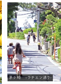
茅ヶ崎 -ラチェン通り-