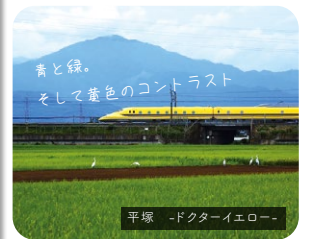
平塚 -ドクターイエロー-