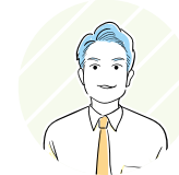
茅ヶ崎市 スタッフ