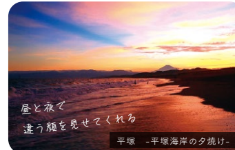
平塚 -平塚海岸の夕焼け-