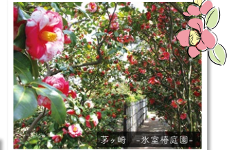
茅ヶ崎 -氷室橋庭園-