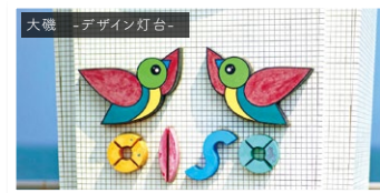
大磯 -デザイン灯台-