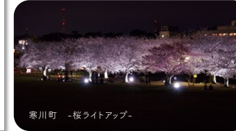
寒川町 -桜ライトアップ-