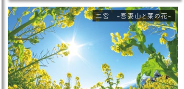
二宮 -吾妻山と菜の花-