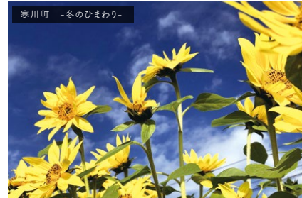
寒川町 -冬のひまわり-