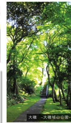
大磯 -大磯城山公園-