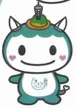
「キュンとするまち。藤沢」 公式マスコットキャラクター ふじキュン♡