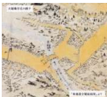
東海道分間延絵図

江戸時代の東海道分間延絵図を頼りに藤沢宿を巡り、古文書、絵図、浮世絵等の資料を繙き宿場の街並み、風情、魅力を垣間見る。