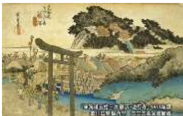
東海道五十三次之内 藤沢