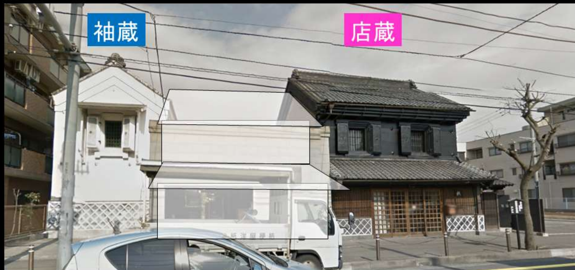
桔梗屋文庫蔵(文久元年(1861年))