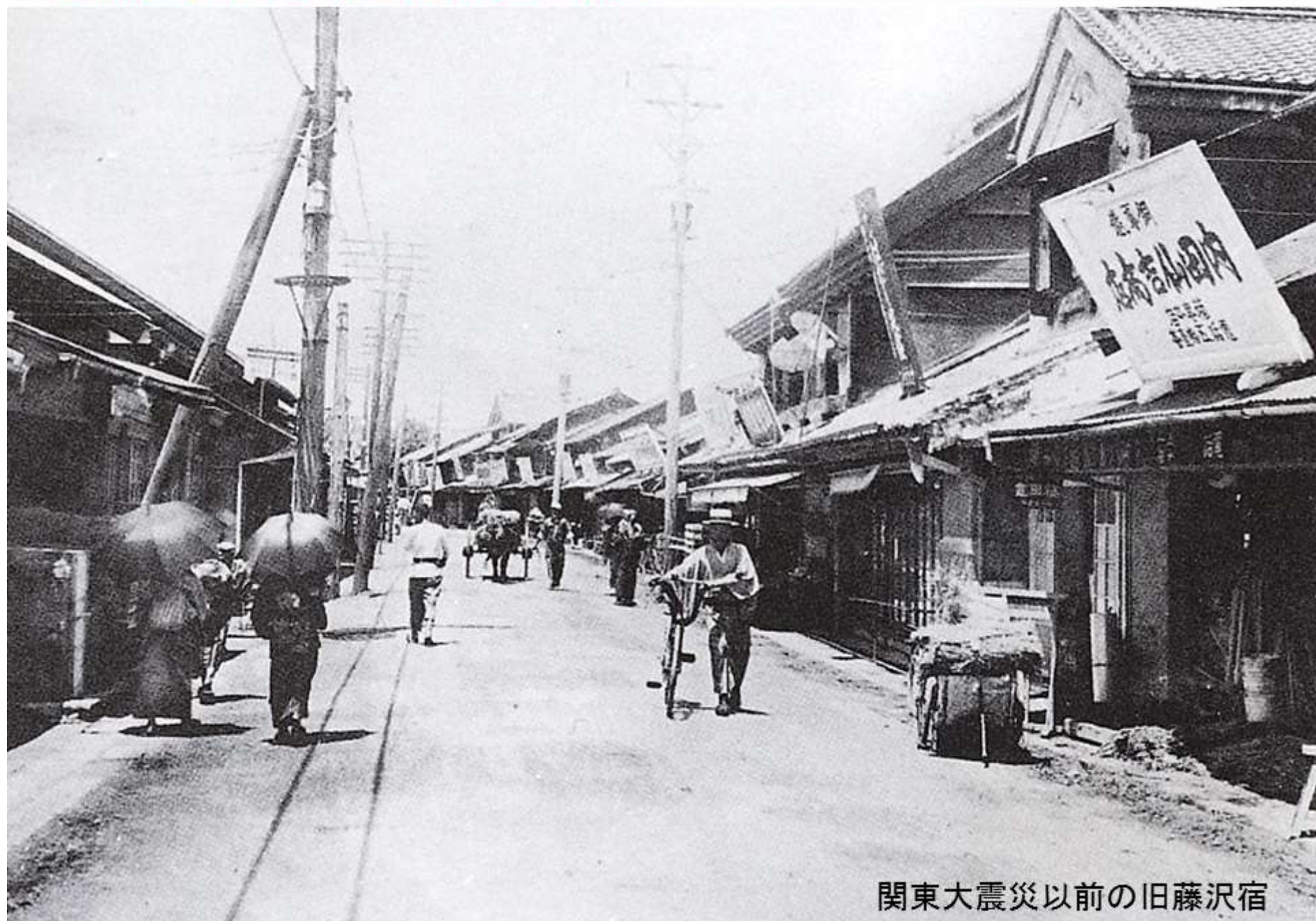
関東大震災以前の旧藤沢宿