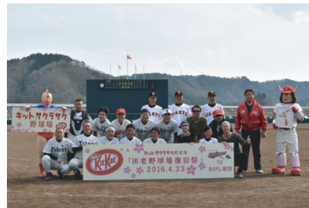
復旧祭の記念試合に参加した選手

復旧祭では、子どもたちが連続安打の日本記録に挑戦したほか、草野球チーム「三陸鉄道キット Dreams（ドリームス）」とタレントのダンカンさんがキャプテンを務める「たけし軍団スペシャルチーム」との記念試合が行われ、珍プレーに新球場は歓声に包まれました。