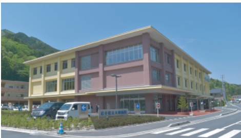
完成した県立大槌病院

県内では、県立大槌病院のほか、県立山田病院と県立高田病院も被災し、現在、仮設診療所で診療を続けていますが、山田病院は今秋、高田病院は来年度中の開院を目指し整備を進めています。