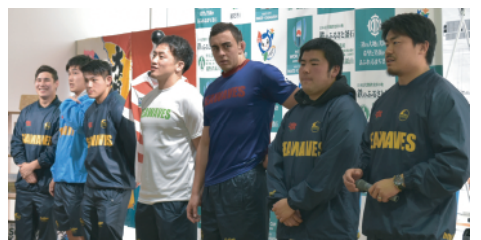
オープニングセレモニーに参加した「釜石シーウェイブスR.F.C」の選手