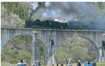
「SL 銀河」を撮影する観光客

今シーズンは、三陸鉄道南リアス線が、同列車の下り列車の運行に合わせて釜石駅から盛駅（大船渡市）間をレトロ調車両での臨時列車を運行しており、沿岸地域の観光振興に大きな期待が寄せられています。