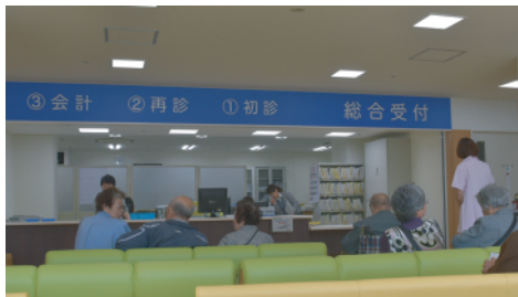
外来診療が始まった県立大槌病院