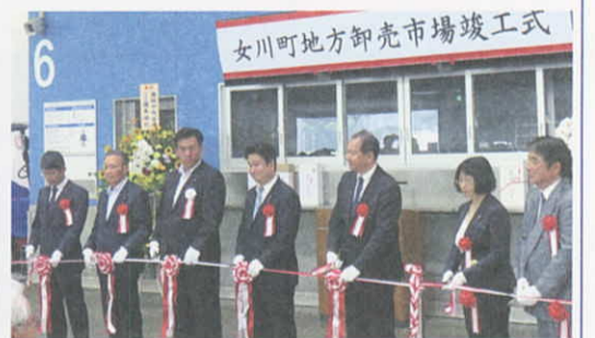
5月30日 女川町地方卸売市場の竣工式(女川町)