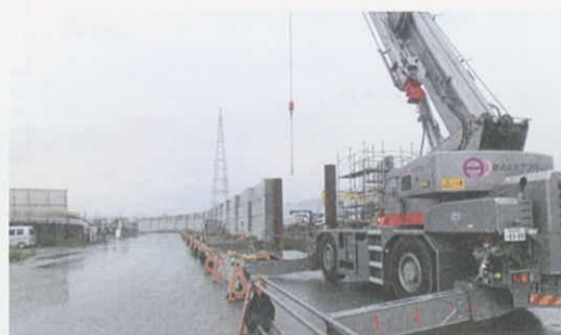
整備進む商港岸壁の防波堤(気仙沼市)