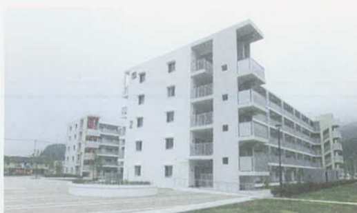
鹿折南住宅(気仙沼市)