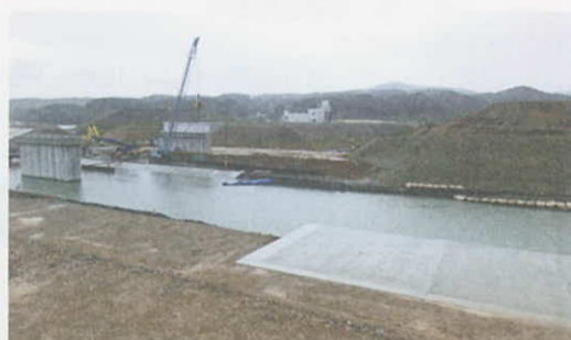
かさ上げ工事の進む志津川市街地(南三陸町)