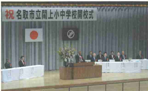
▲開校式のようす