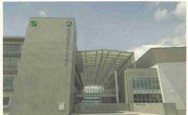
▲向かって左側が校舎。右側が体育館。手前に外階段があり、屋上に登ることができます。