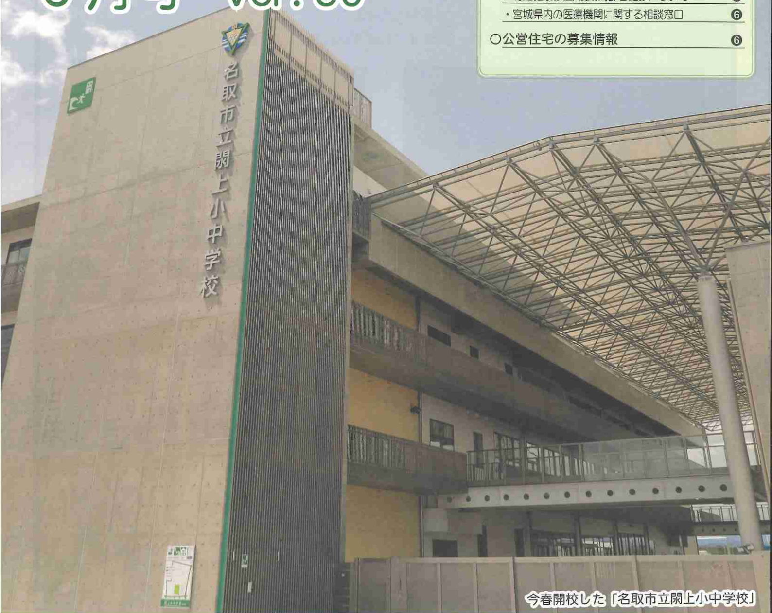
今春開校した「名取市立閉上小中学校」