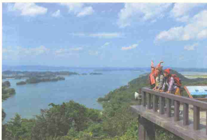
▲奥松島コース大高森からの眺望。

「気仙沼・唐桑コース」のオープニングセレモニーには約500人が、「奥松島コース」には約800人が参加し、雄大な景色を楽しみました。