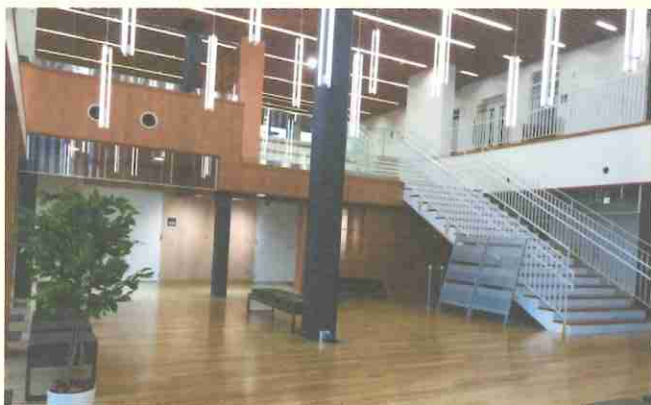
▲石巻の観光・物産情報などを発信するスペースで、休憩や待合せなど、誰でも自由にご利用いただけます。

元気いちばとの相乗効果で、交流人口の増加や新たなにぎわい創出の場として期待されています。