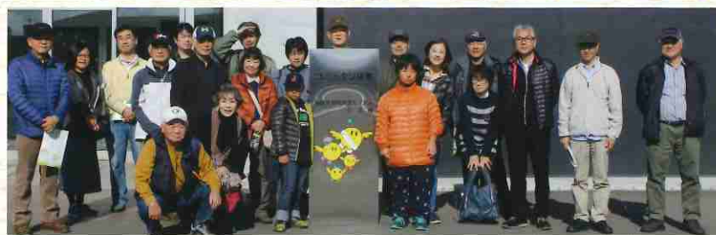
次の日は三春町の「コミュニティ福島」を見学しました。