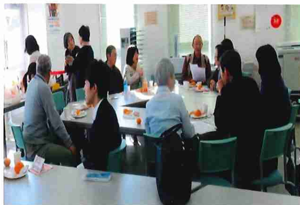
お茶っこ会の様子

東日本大震災および原発事故により 神奈川県内・近郊に避難されている方々が集い 軽食・お菓子・飲み物を頂きながら話し合う場です