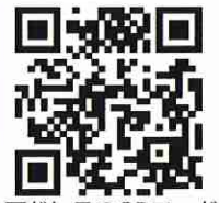
宛先アドレスのQRコード

お申し込み内容確認のため、返信させていただくことがあります。迷惑メールフィルターご利用の場合、当アドレスが受信できるよう設定をお願いいたします。