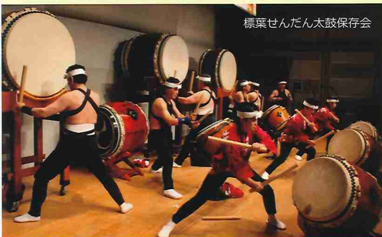
標葉せんだん太鼓保存会

ふるさとコミュニティ会場から、他地域の複数の避難 当事者団体とオンラインによる交流会を実施します