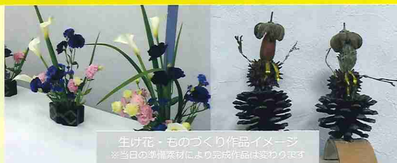
生け花・ものづくり作品イメージ ※当日の準備素材により完成作品は変わります