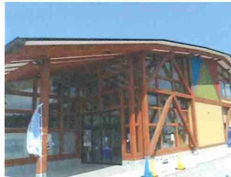
⑤いしのまき元気市場（石巻市）