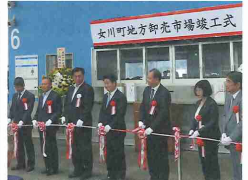
④女川町地方卸売市場（女川町）