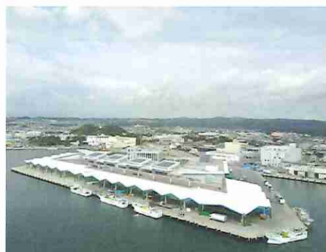
⑨塩釜市魚市場（塩釜市）