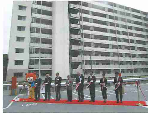
③市営気仙沼駅前住宅（気仙沼市）