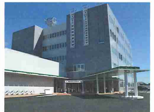
⑧気仙沼合同庁舎の新庁舎（気仙沼市）