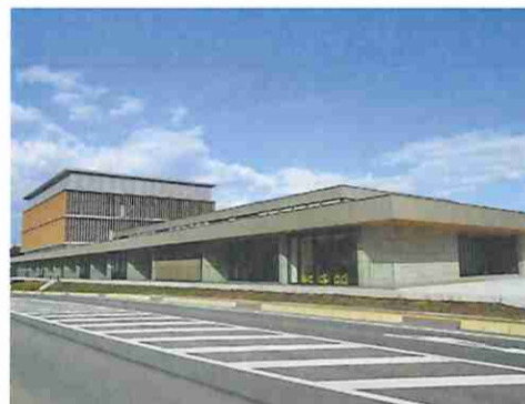
⑦南三陸町役場の新庁舎（南三陸町）