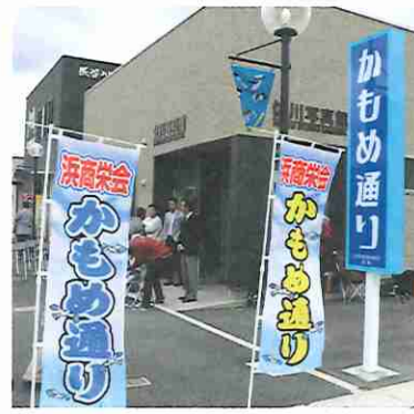
①かもめ通り商店街（気仙沼市）