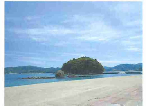
⑥サンオーレそではま海水浴場（南三陸町）