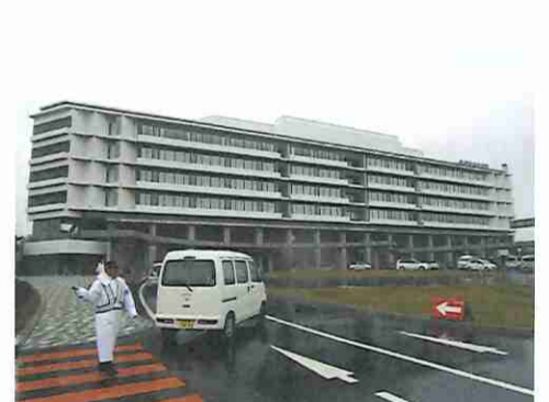
⑩気仙沼市立病院（気仙沼市）