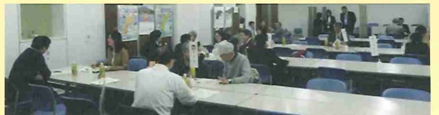
平成29年10月21日(日)に東京で開催した交流相談会の様子