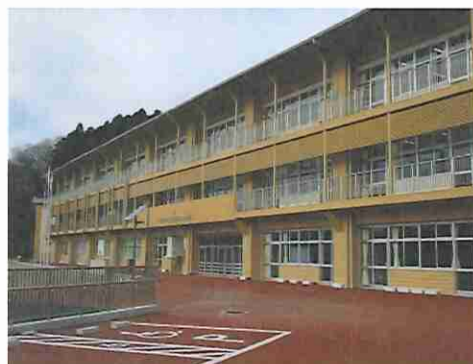
⑪鳴瀬未来中学校（東松島市）