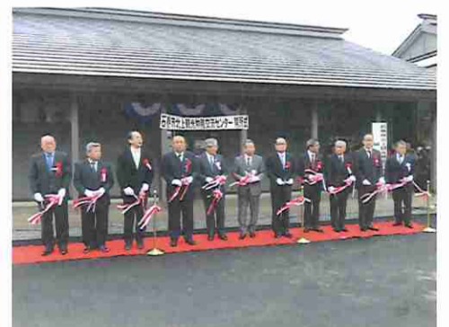
⑫石巻市北地区の「物産交流センター」（石巻市） 復興庁ホームページ