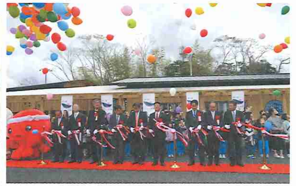
②商店街「ハマレ歌津」（南三陸町）