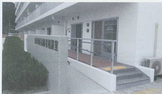
9月30日 鹿折地区高齢者相談室を開設 (気仙沼市)