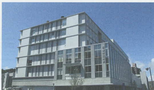
9月1日 市立病院が開院 (石巻市)