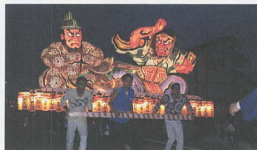
9月24日 あおい地区でまちびらき(東松島市)