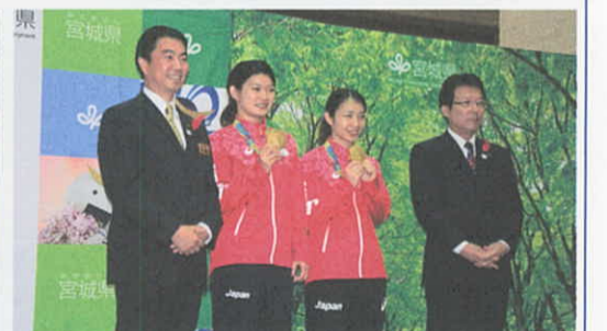
10月5日 リオ五輪バドミントンの高松ペアに県民栄誉賞を授与(仙台市) ※所属：日本ユニシス