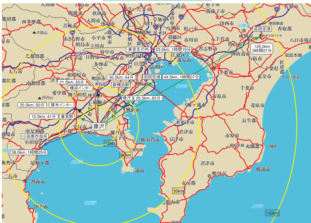
周辺都市までの距離と時間

中心市街地へ集中する慢性的な交通混雑の緩和や環境負荷を軽減する公共交通機関の整備、地域の環境に調和し、地域間の交流連携や市民の日常生活をささえる生活交通ネットワークの整備、地域の特性に配慮しつつ、人や物の内外との自由な交流、連携をささえる新しい広域交通ネットワークの整備など、総合的な交通ネットワークの整備が求められています。