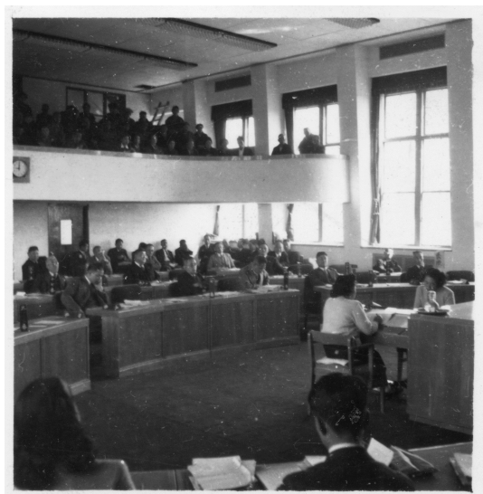
昭和26年当時の議場