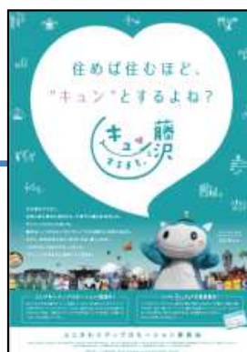
市内公共施設など市内各所にて掲出