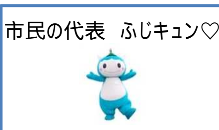
市民の代表 ふじキュン♡