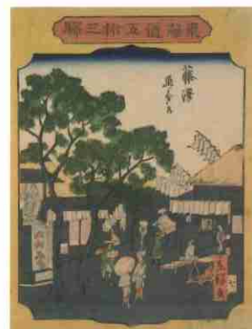
二代歌川広重 「東海道五拾三駅 藤沢 追分道」

浮世絵師の中には、著名な師匠の名を受け継ぎ、二代目、三代目を名乗って活躍した者が多くいました。二代目を襲名するという事は、歌舞伎役者と同様に、師匠の名声や技術を受け継ぐばかりでなく、さらなる飛躍が期待されることでもあります。