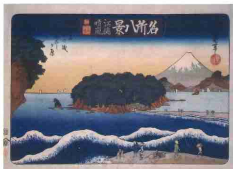
二代歌川豊国「名所八景 江ノ嶋晴嵐」