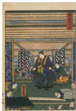
二代歌川国貞 「東海道 戸塚」

本展では、二代目浮世絵師たちが描いた藤沢ゆかりの作品を展示します。師匠の絵と比較しながら、襲名絵師たちの個性や奮闘ぶりを存分にお楽しみください。