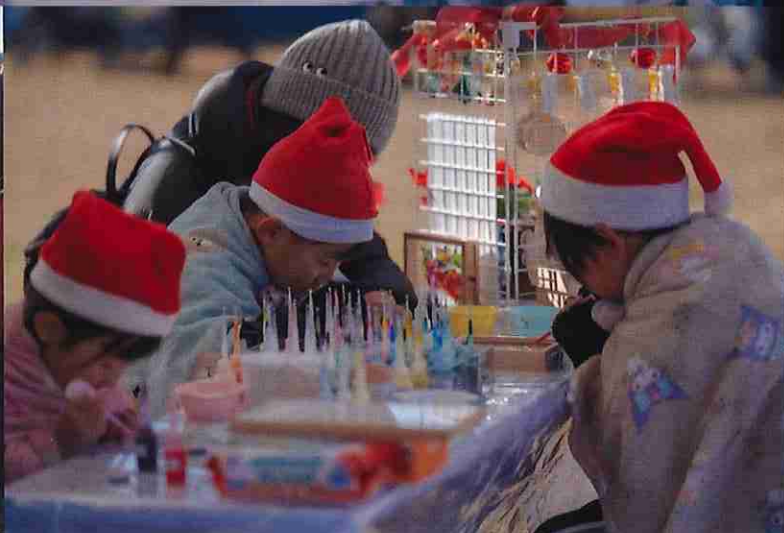
※12月クリスマスマーケット時の写真となります