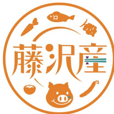
「藤沢産」ロゴマーク

本市でどのような農業が展開され、どのような農産物が栽培されているのかを周知し、市民が農業と触れ合う機会を提供することで、農業を身近に感じることができ、地産地消を推進することが必要です。