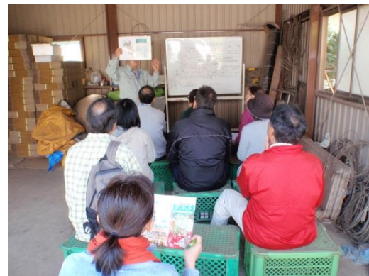
援農ボランティアの活動