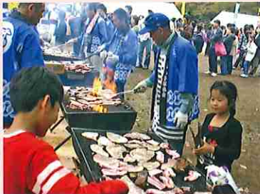
豚肉のポークチョップ