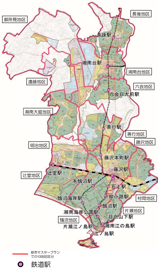
図：都市マスの13地区区分 (藤沢市都市マスタープラン)