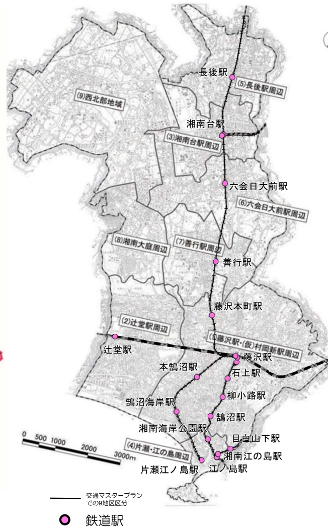
図：交通マスの9地区区分 (藤沢市交通マスタープラン)