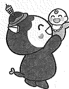
救命講習Ⅲ 乳児・幼児に対 する応急手当